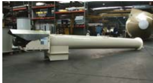
Throughput rate 2 to 500 m 3 /h Screw diameter 200 to 1,000 mm