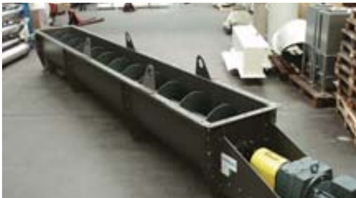
Durchsatzvolumen 2 bis 500 m 3 /h Schneckendurchmesser 200 bis 1.000 mm